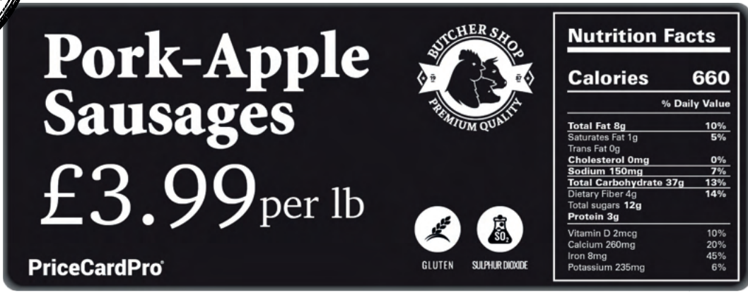
140 x 54 mm