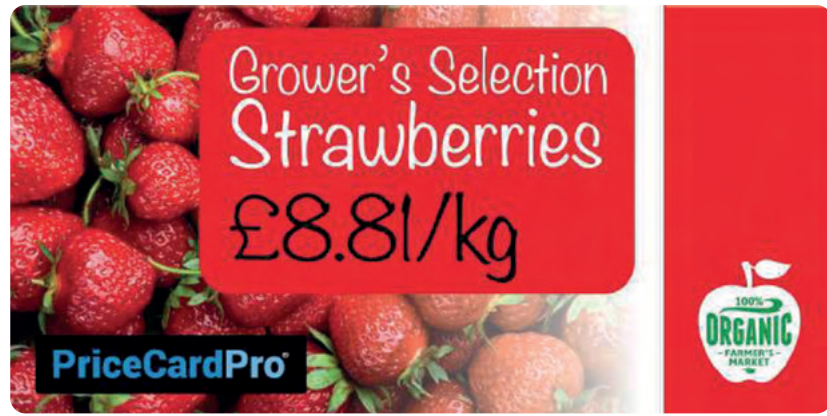
109 x 54 mm,