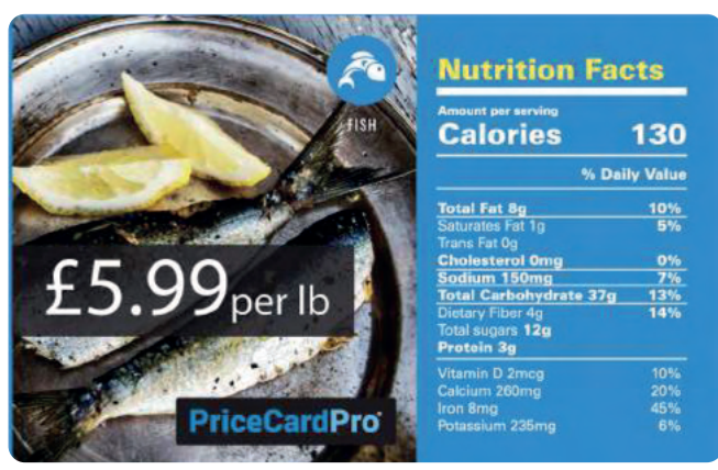
86 x 54 mm