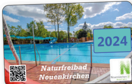
Mustersausweise der Gemeinde Neuenkirchen